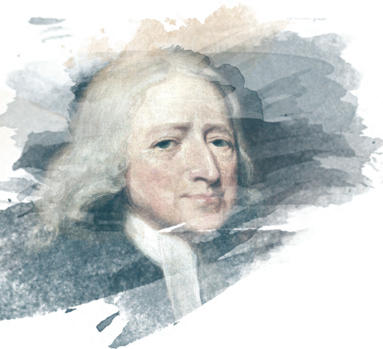
John Wesley, 1703-1791 Fundador del Movimiento Metodista